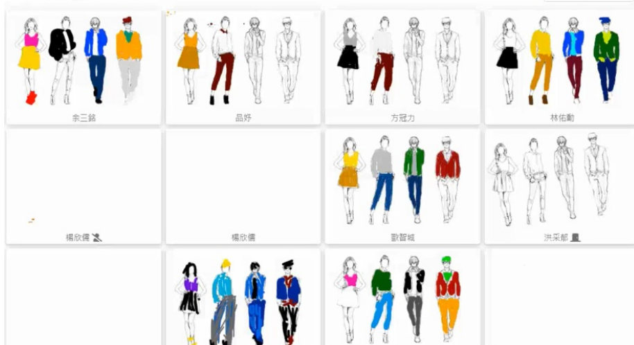
服裝配色練習-1(講座)