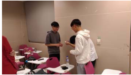
交換名片/自我介紹-2