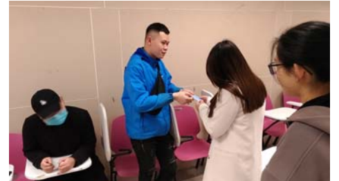
交換名片/自我介紹-3