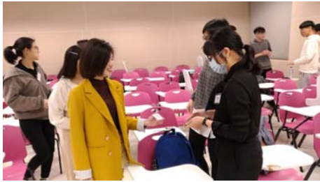
交換名片/自我介紹-1