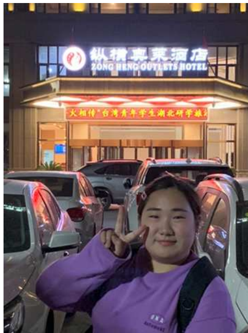
相片3. 2019年11月21日 第一天武漢縱橫奧萊大酒店