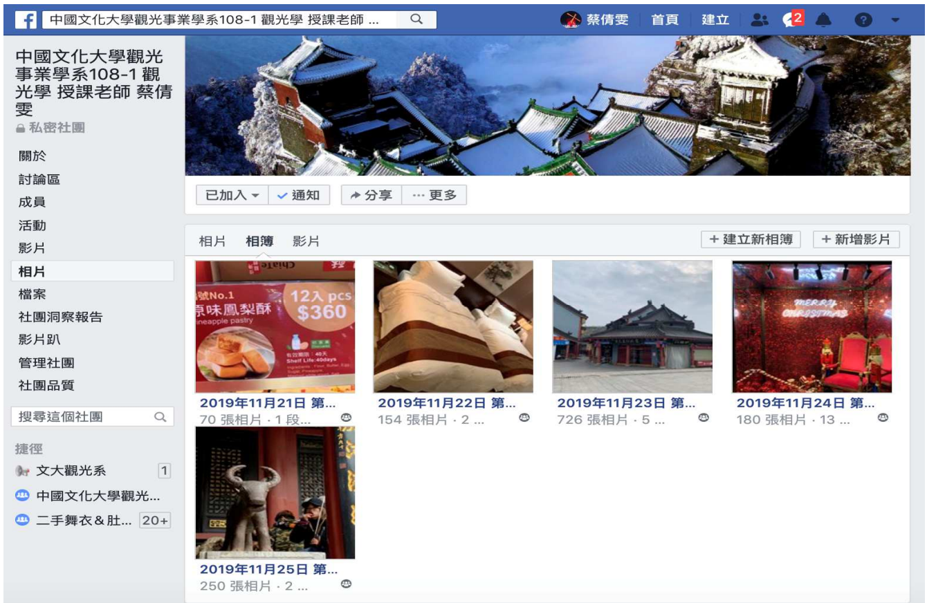
相片16. FACEBOOK上建置相片區