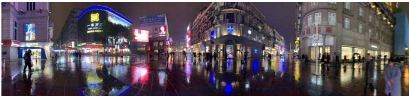
相片14. 2019年11月24日 第四天 江漢路步行街