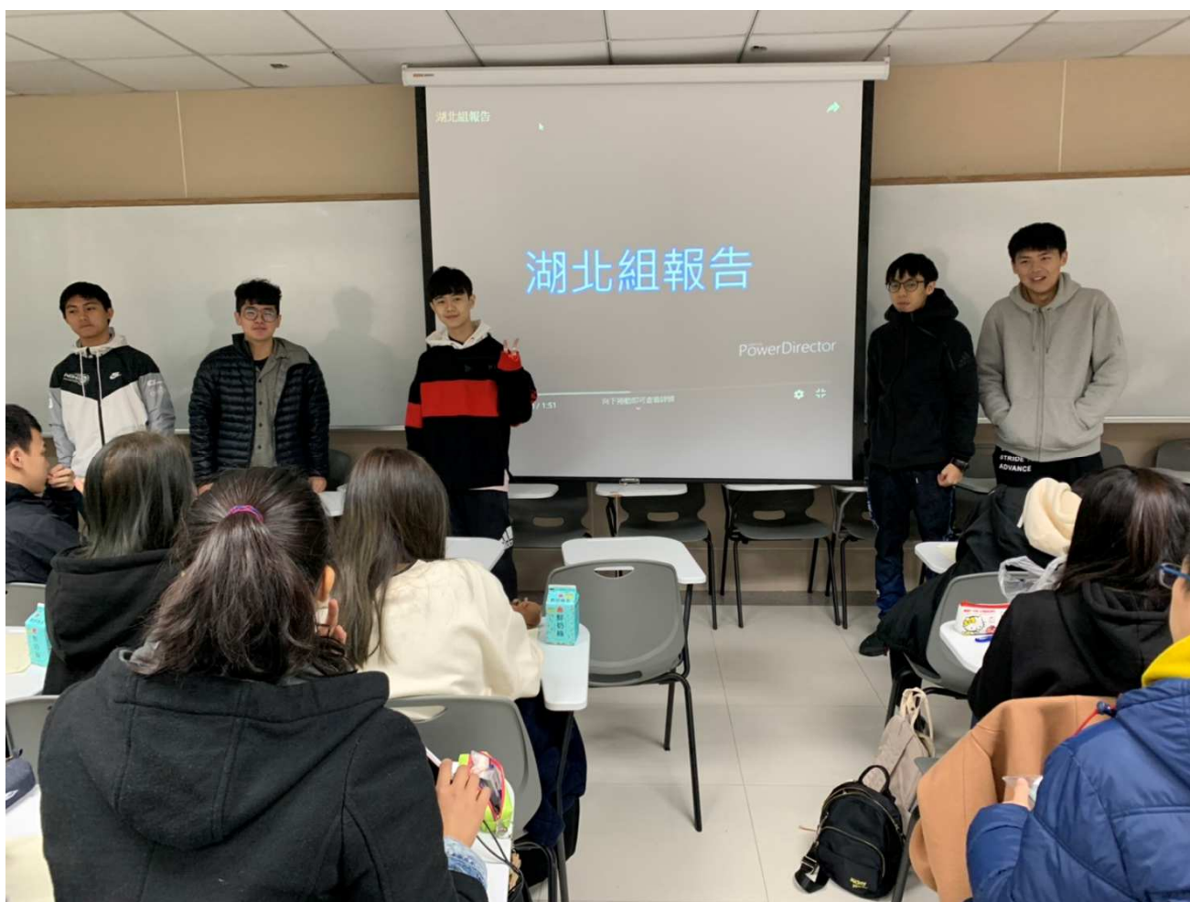
圖6 各大陸組學生們期末口頭報告

「觀光學」課堂中所學到的知識與產業常識加以相互驗證。尤其，希望能啟發剛入學的一年級觀光系學生對於觀光產業的興趣與視野，亦培養學生能將理論與實務並進，嘗試從理論所學出發，透過應用體驗式學習與個案研究法及現實世界中的兩岸知名觀光產業，由被服務的對象(消費者)的眼光來看待整個觀光產業鏈，驗證、觀察實務上企業如何運作，最後，驗證所學理論於所接觸的觀光企業實務上，並反饋於自己未來的角色(觀光服務的提供者)上。提升學生對於從事觀光專業的興趣，為學生未來如何選擇觀光專業(航空、旅行業、會展、餐旅館業、休閒遊憩、目的地產業等)作為其專業學習與實習場域，將有很大的助益。