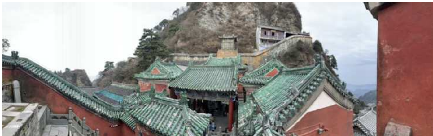
相片6. 2019年11月23日 第三天 武當山金頂 世界文化遺產