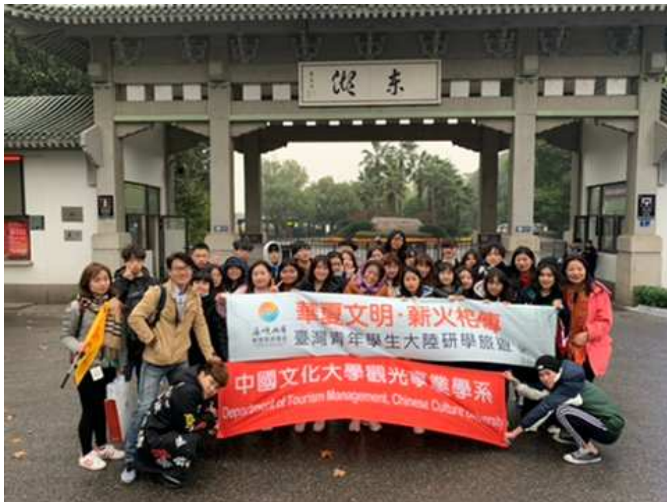
相片13. 2019年11月24日 第四天 東湖聽濤