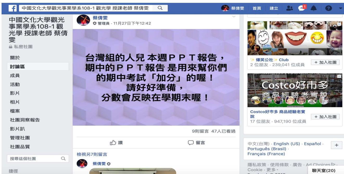
相片19. 台灣組 期中口試(期末完整報告)