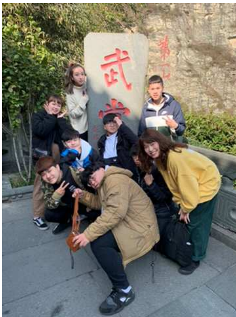
相片7. 2019年11月23日 第三天 武當山世界文化遺產