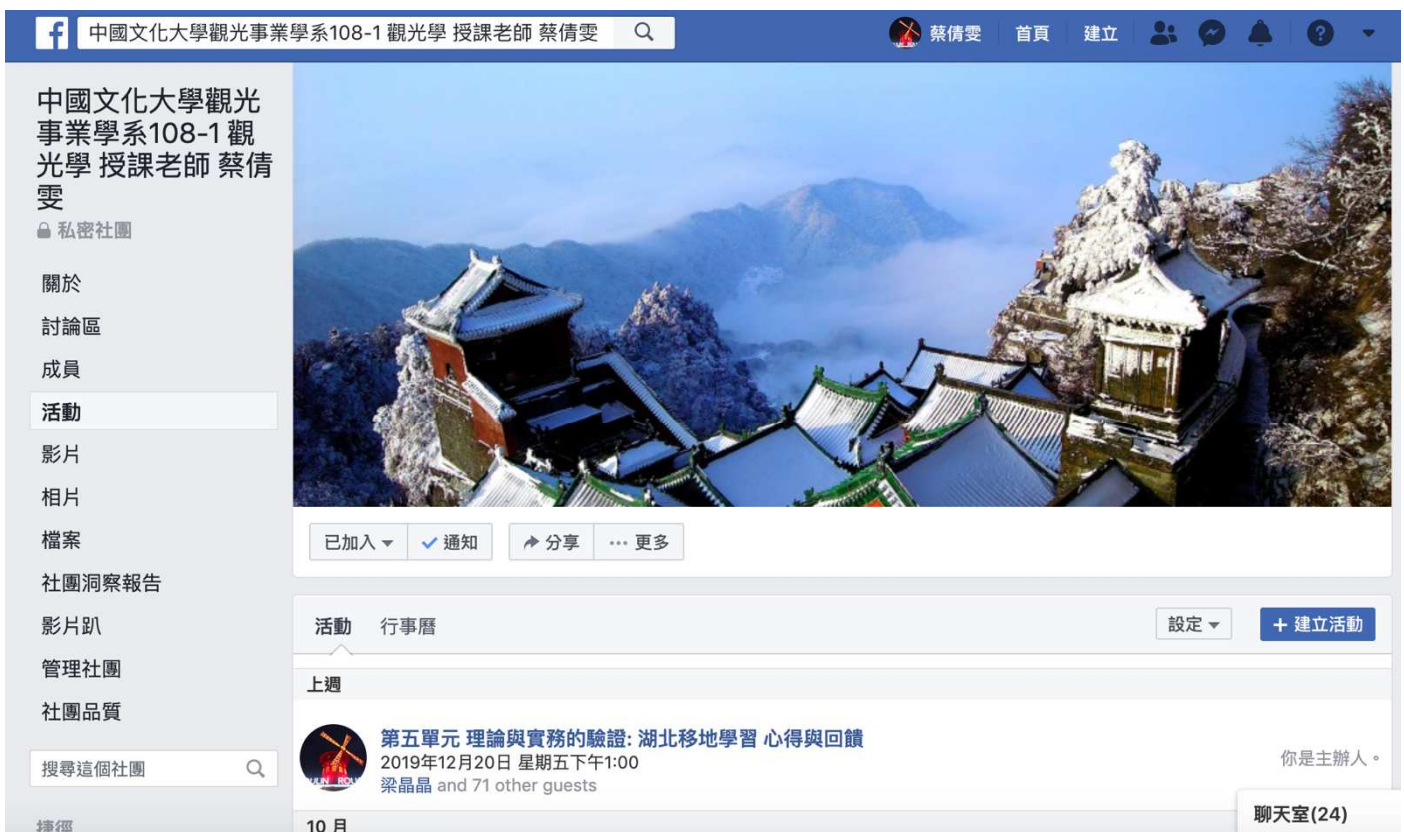
圖1 教師用端的Facebook社群

課程結束徵得同學們同意，將對外開放展示。本計劃之「創新課程規劃」以及「創新教材教法」會記錄於學生所使用的網站科技平台，教師用端的Facebook社群也會永久留存，作為教學實踐的過程。