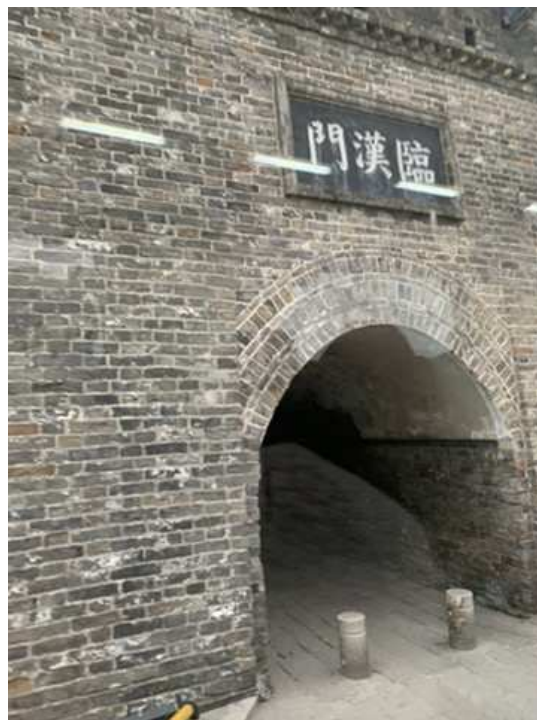
相片11. 2019年11月24日 第四天襄陽古城牆