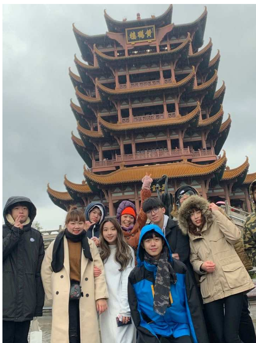
相片15. 2019年11月25日 第五天 黃鶴樓