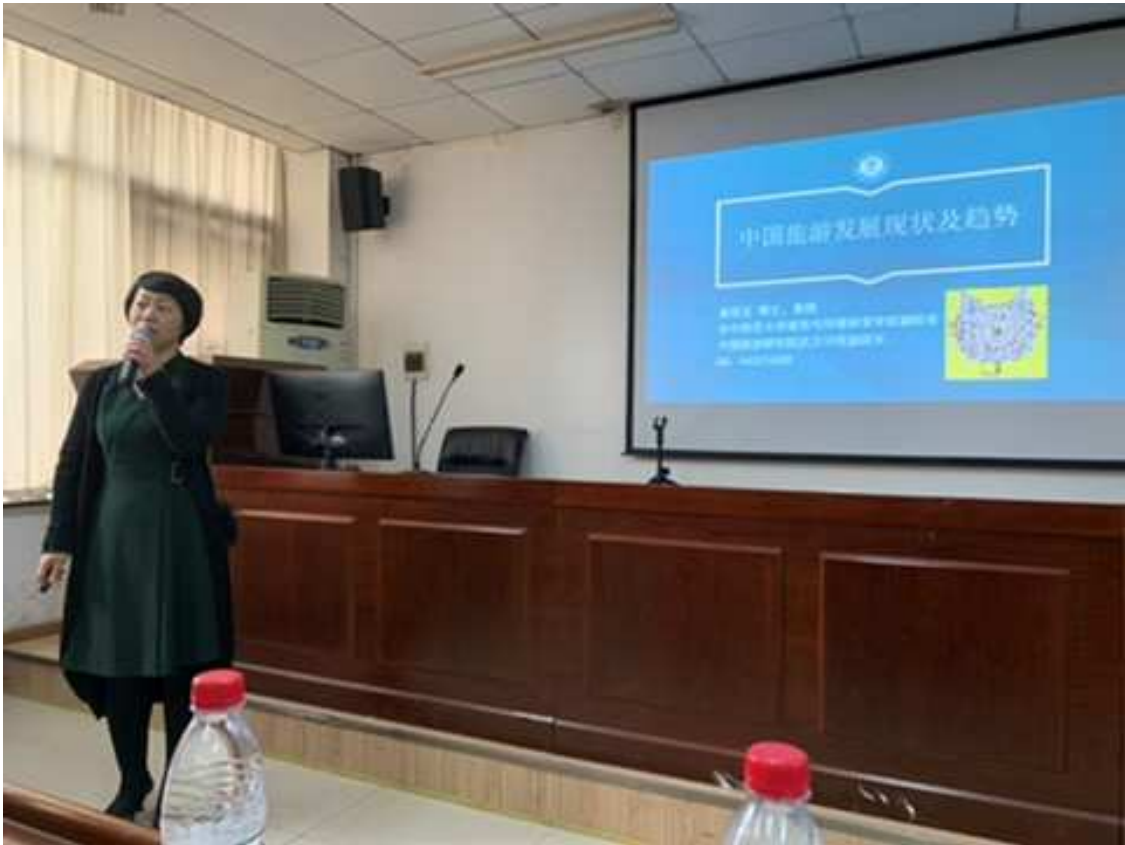
相片4. 2019年11月22日 第二天華中師範大學 旅遊學院院長講座