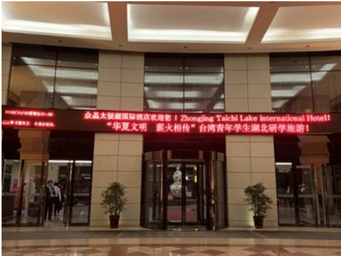
相片5. 武當太極湖國際酒店