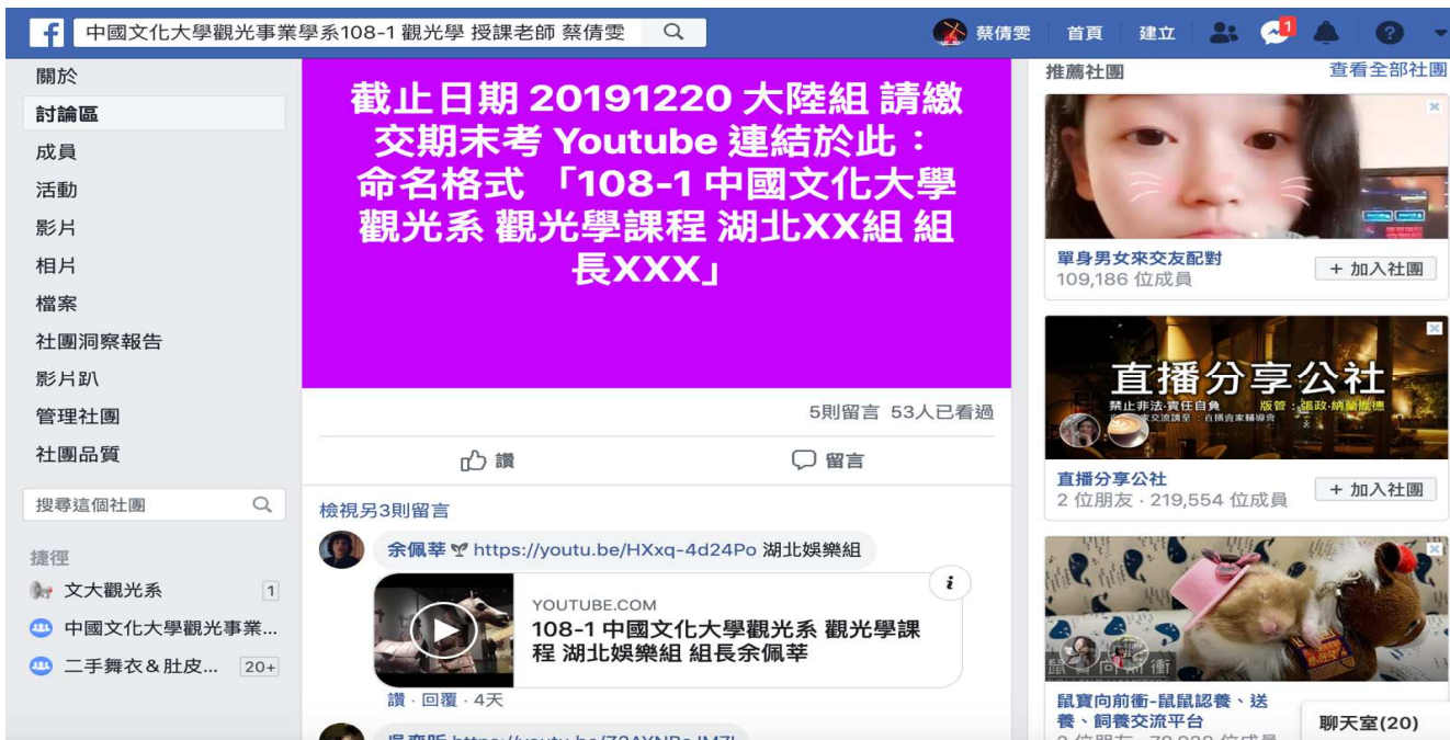
相片18. 大陸組 期末考試