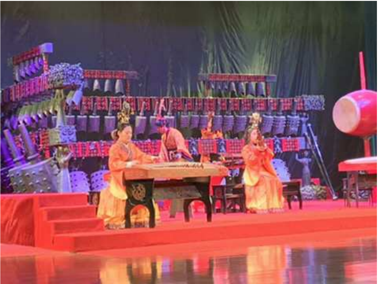
相片12. 2019年11月24日 第四天 編鐘文化 世界文化遺產