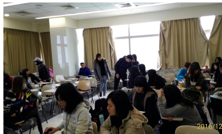
(4) 完成重度視障者定向行動