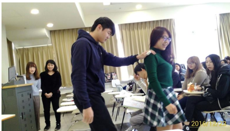
(3) 感覺重度視障者定向行動