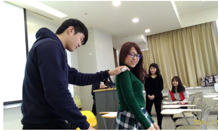
(2) 體驗重度視障者定向行動