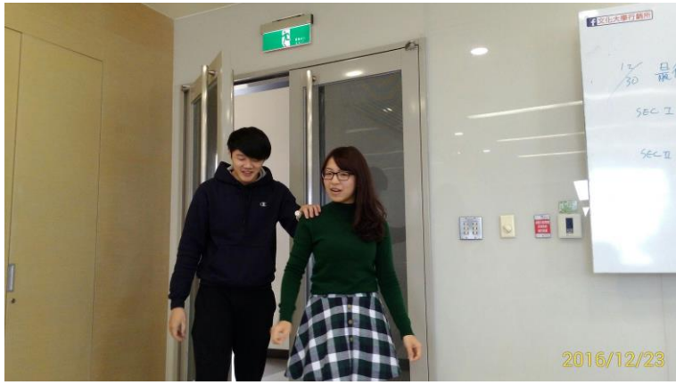
(1) 重度視障者(左)定向行動訓練