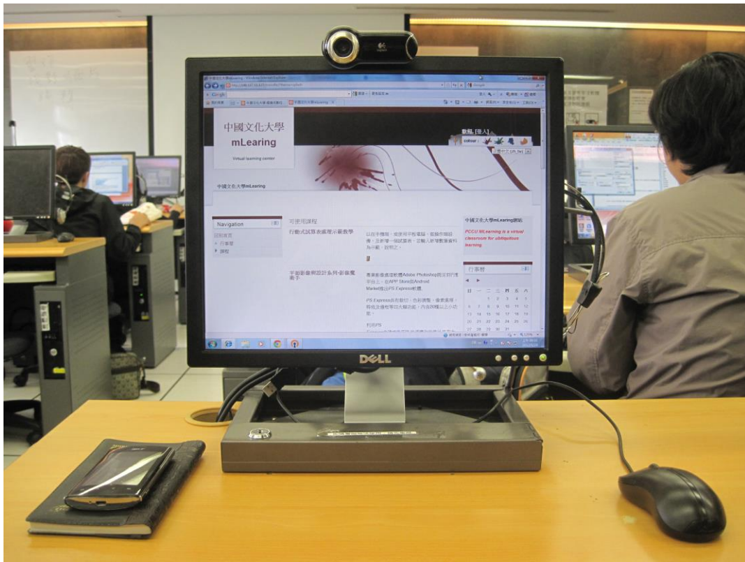
圖三、整合Twitter快速回饋機制及行動化-Learning系統