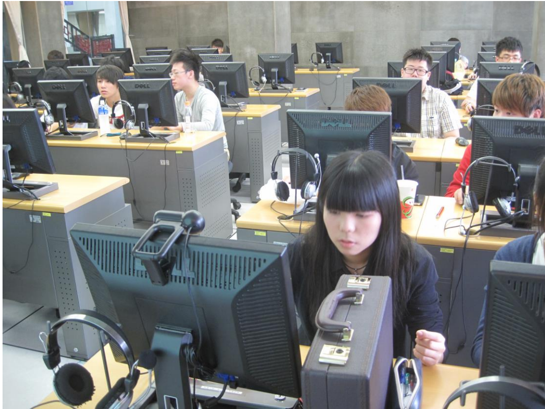
圖五、課堂利用twitter線上小組討論