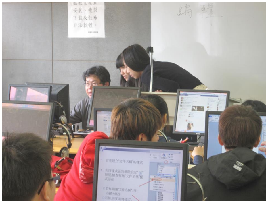
圖四、利用twitter反應後教師可以即時做課堂學習討論