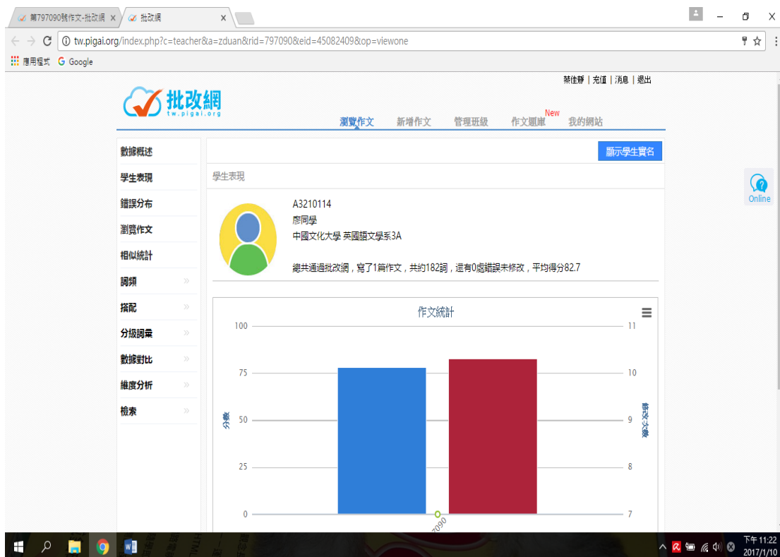
圖六：學生寫作之數據分析