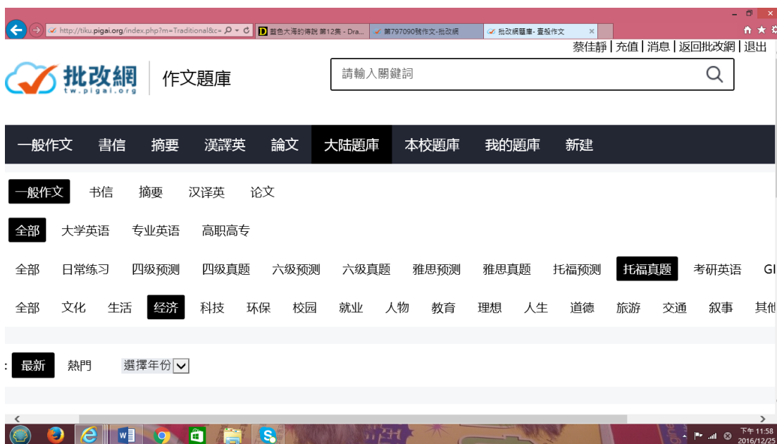
圖一：批改網作文題庫