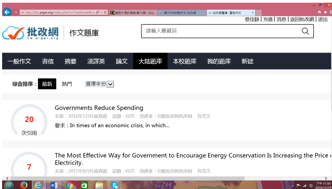
圖二：作文題目引用次數