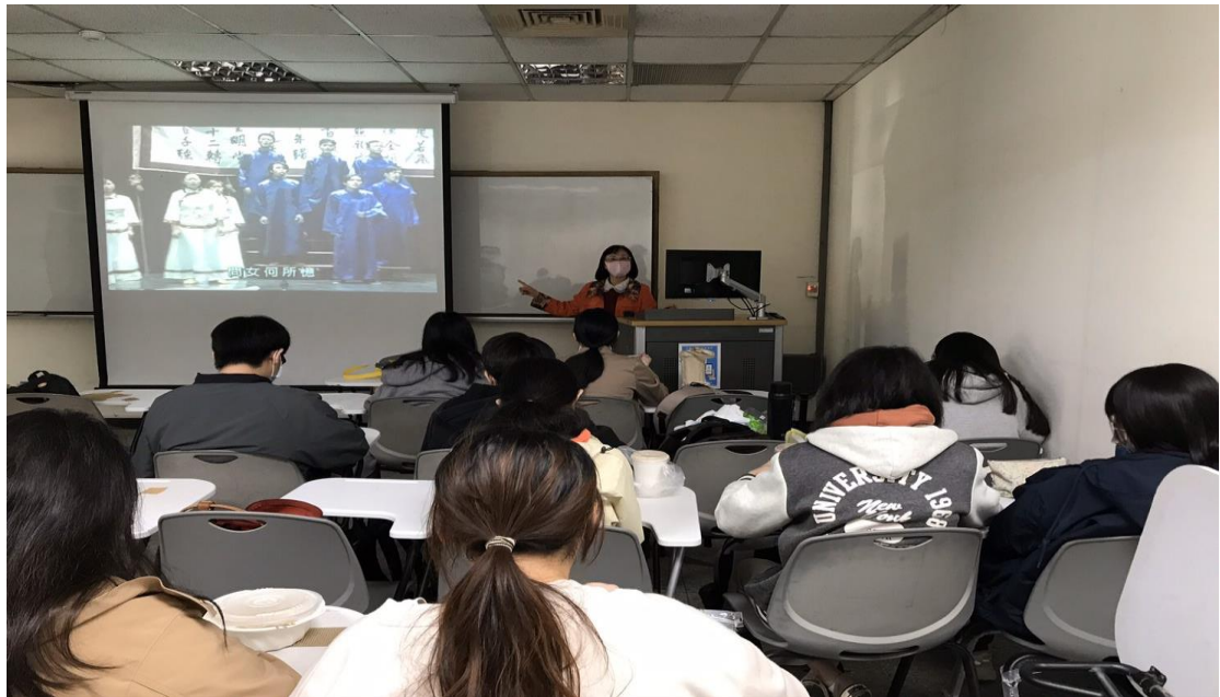
圖一：鳳鳴吟社教唱練習