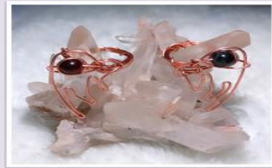
「陰陽太極」情侶戒指