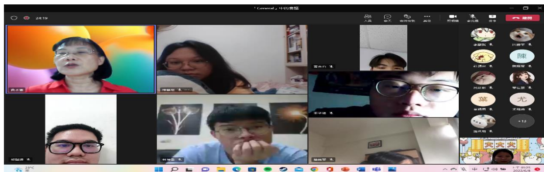
圖三：線上分組報告